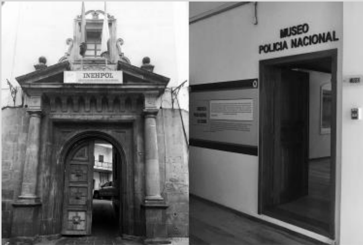
Fachada del Edificio del Instituto de Estudios Históricos de la Policía Nacional donde funciona el Museo Policial.